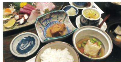
ボリューム満点お刺身ご膳

聴き力とは、相手の話を耳、目、心をフルに活用して注意深く積極的に聴こうとする姿勢のことでした。相手の表情や声のトーンなど非言語の部分に注意を払い、相手の気持ち感情に寄り添いながら聴くということです。