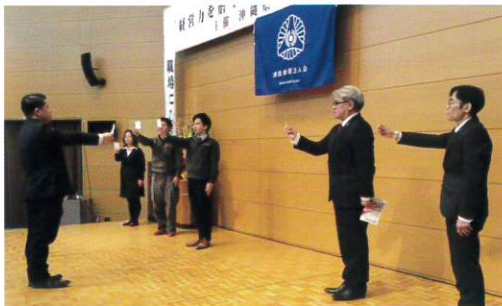
(株)紙商のみなさんによる活力朝礼の実演