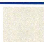
事務長 我喜屋 宗昭 なんくる農場