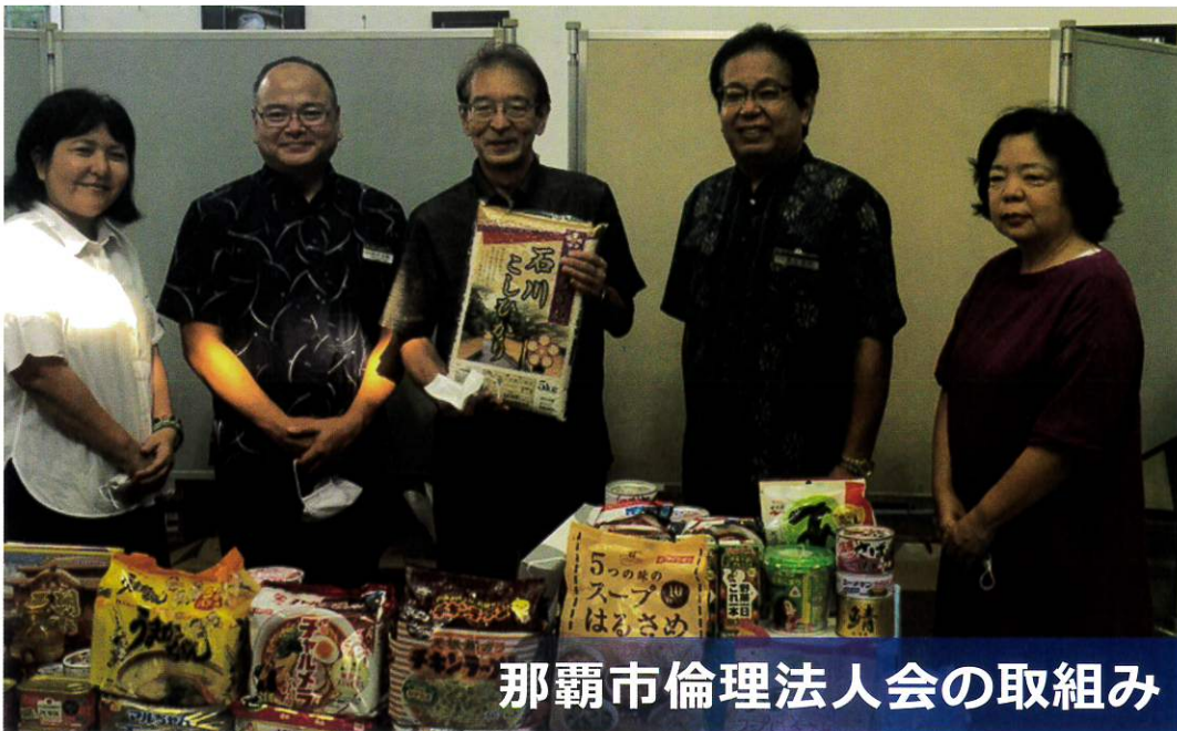
那覇市倫理法人会の取組み