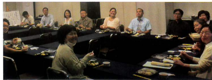
那覇市倫理法人会のみなさん

はい、私たちだけの力には限界があります。皆さまのご協力や支援で広く多く、そして長く、継続していければと考えております。本日は、ありがとうございました。